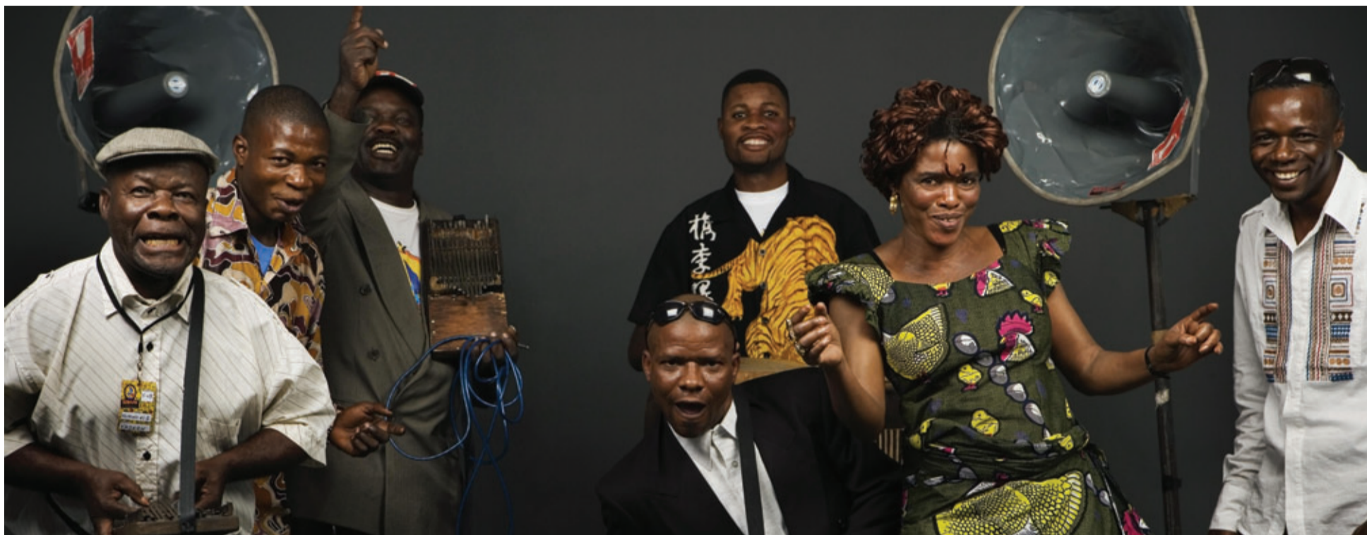
CONCERTO / PROJEÇÃO DE CINEMA KONONO Nº1 / DJIBRIL DIOP MAMBÉTY

tailandesa que significa Mono Pause, mas que é também o nome de um prato típico do Laos, com frango, coco e folhas de bananeira! A banda toca interpretações de canções pop, rock e 'psych-folk' asiáticas e de música tradicional oriental, fruto das suas viagens pela região. Os Neung Phak trazem-nos sons de espectro internacional que trocam o verniz e lustre da "world music" pela energia e imprevisibilidade que podem de facto transportar-nos para lugares distantes.