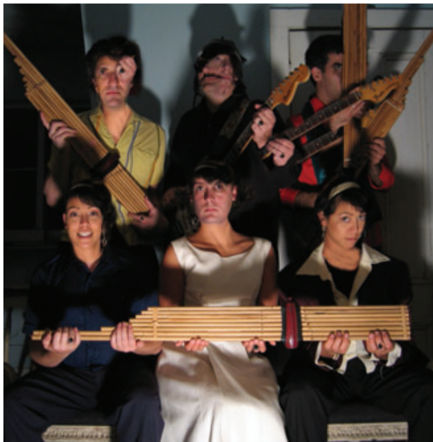
MÚSICA NEUNG PHAK