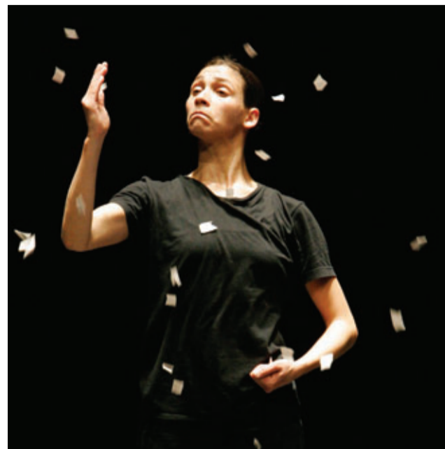
TEATRO VISUAL NOITE DE REIS