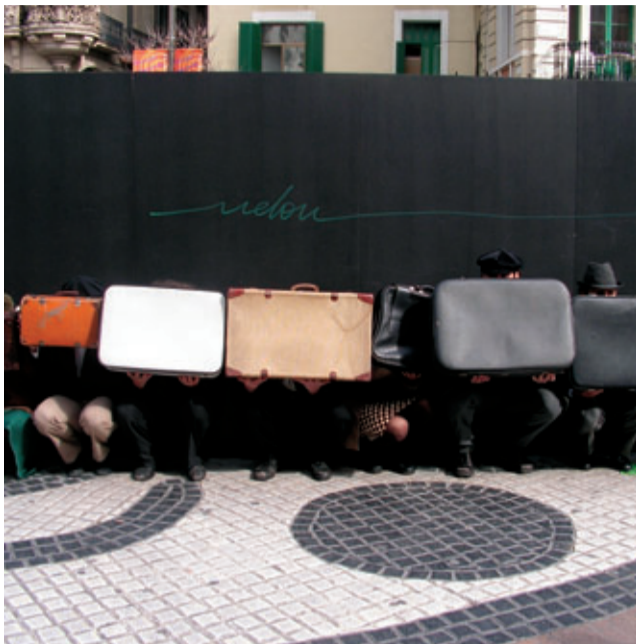
TEATRO DE RUA KAMCHÀTKA