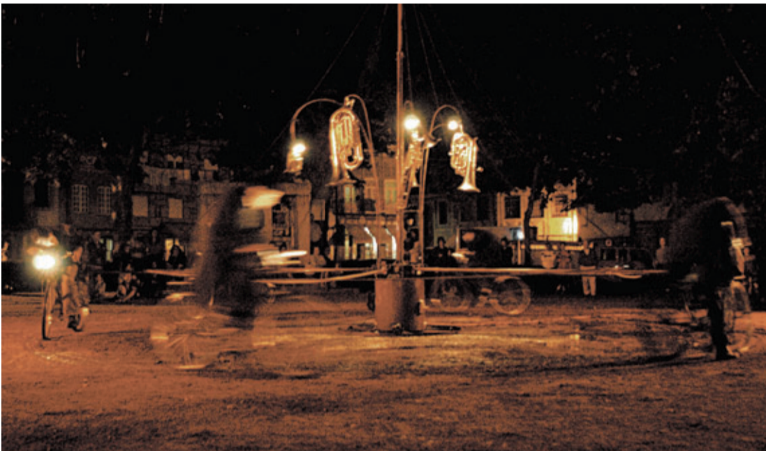
NOVO CIRCO CHARANGA