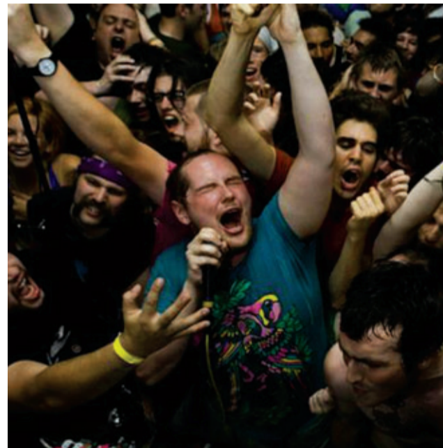
MÚSICA ELECTRÓNICA DAN DEACON

16h30 TEATRO PARA INFÂNCIA E JUVENTUDE RETALHOS EM VIAGEM TEATRO DO FRIO LOCAL: ARBORETO SÉCULO XIX