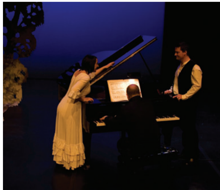
ÓPERA DIÁRIO DE UM DESAPARECIDO

re-interpreta peças contemporâneas para outros instrumentos e aventura-se pelos territórios da improvisação e afins, recorrendo pontualmente a subtis manipulações electrónicas.