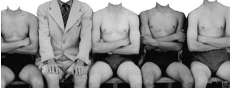
MÚSICA CLUBE DOS NADADORES DE INVERNO