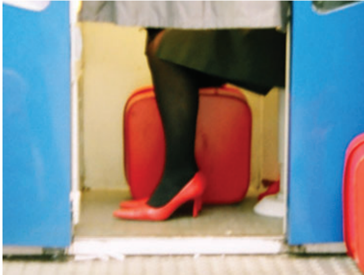
TEATRO DE RUA RED LADIES