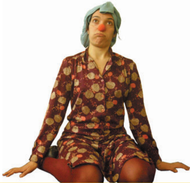
TEATRO A GALINHA DA MINHA VIZINHA