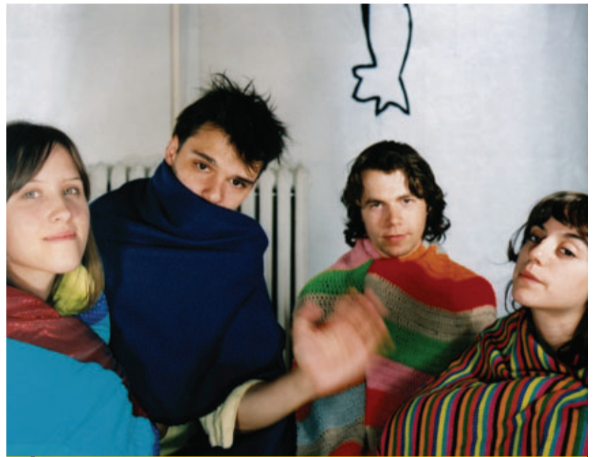
MÚSICA DIRTY PROJECTORS