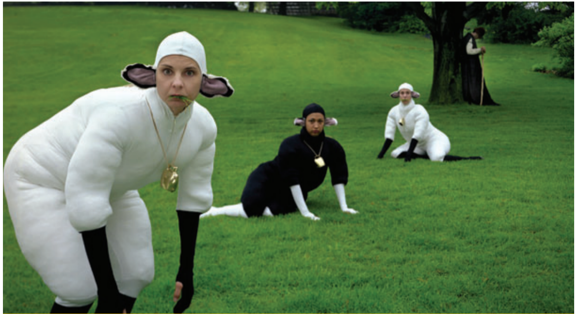
TEATRO DE RUA LES MOUTONS