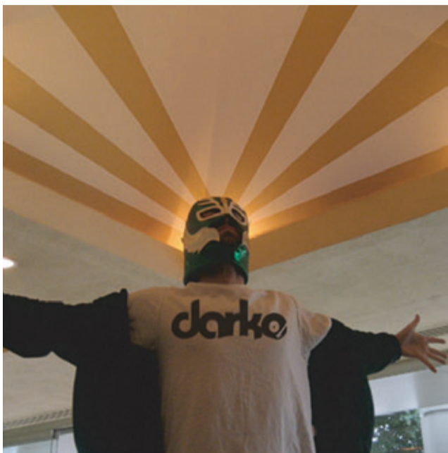
MÚSICA PASE ROCK & DARKO